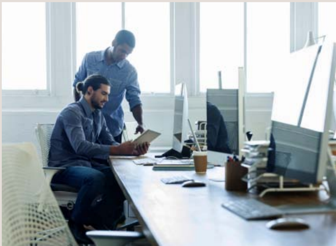
Delingsøkonomien kan i ytterste konsekvens ta oss til et førindustrielt samfunn hvor arbeidsfolk i større grad eier sin egen tid og sitt eget produksjonsutstyr, og hvor den økonomiske interaksjonen først og fremst foregår på markedsplassene, eller på «plattformene» som det nå heter.

Vi organiserer oss i bedrifter fordi det koster å bruke markedet, sa Coase. Det koster å finne den rette kjøper eller den rette selger (søkekostnader), og ved hyppige og/eller kompliserte